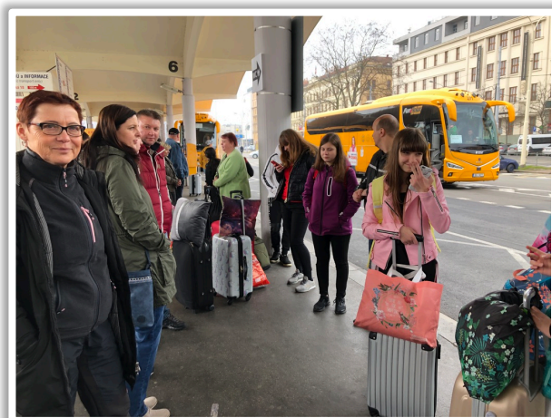
Čekání na autobus

V neděli 14. 4. jsme v 11 hodin dopoledne odstartovali z Brna naši cestu do Anglie. Dohromady jelo 12 dětí a 2 učitelky. Po dvou hodinách cesty jsme si udělali zastávku v Telči, kde jsme nabrali další školní skupinu. Pro dámské osazenstvo sedmé třídy to bylo docela zklamání, protože se těšily na Slováky, kteří s námi měli jet dle původního plánu. I tak se ale obě školy rychle spřátelily. Dlouhou cestu autobusem si děti při poslední zastávce v ČR zpříjemnily nákupem jídla v KFC. Toto byla zatím největší událost až do té doby, kdy jsme zjistili, že Slováci jedou kousek před námi a že mají skoro stejný program výletu. Někteří žáci si dlouhou cestu krátili poslechem hudby nebo sledováním filmů, jiní zase povídáním nebo jídlem. Stravu volili velmi vytříbeně - zásoby řízků voněly po celém autobuse. Mezi další pochutiny patřily různé sladkosti, bonbony, pražená kukuřice, brambůrky apod. A tak se stalo, že ti, co se přes den nadopovali cukrem, nemohli v noci v autobuse spát ☺.