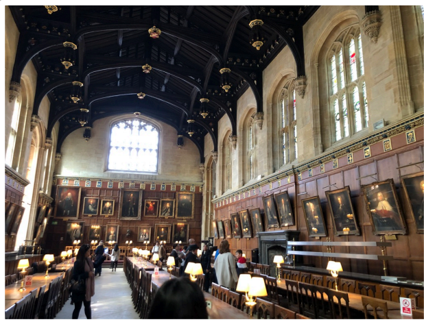
Oxford, Christchurch College