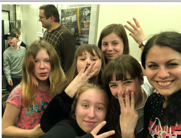
Tunel pod mořským dnem, La Manche